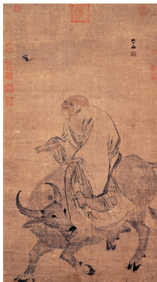
Mynd 1: Zhang Lu (1464-1538) Lao-tse á nautsbaki